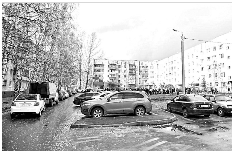
Благодаря губернаторскому проекту «Решаем вместе!» во дворе на улице Попова появились новые парковочные места.

Откорректированные схемы благоустройства дворов уже согласованы с советами много-