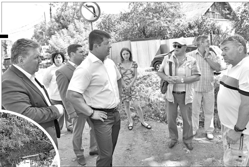
На Ямской улице сделают асфальтировку картами.

Перед его приездом один самосвал асфальто-