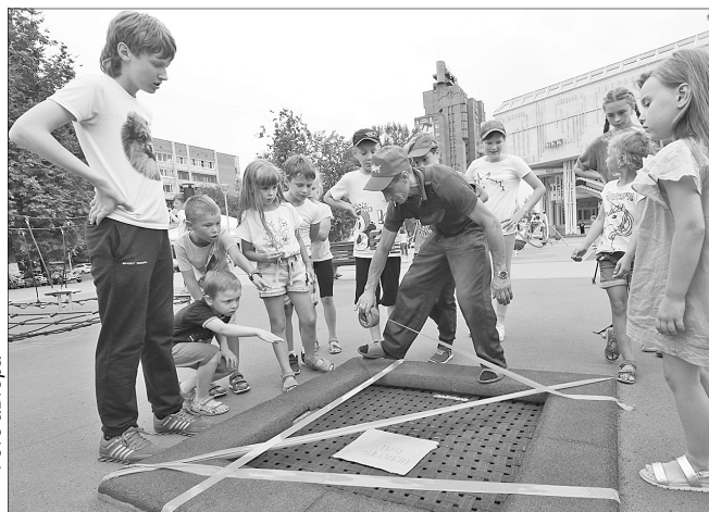
Мини-батут — на ремонт.

26 июля в детский городок на площади Юности пришли рабочие с набором инструментов. Они производили профосмотр оборудования.