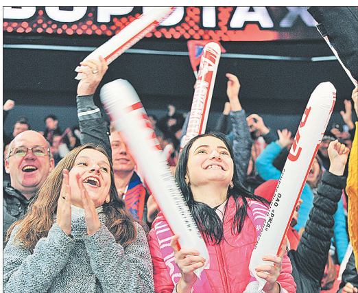
Болеем за наших.