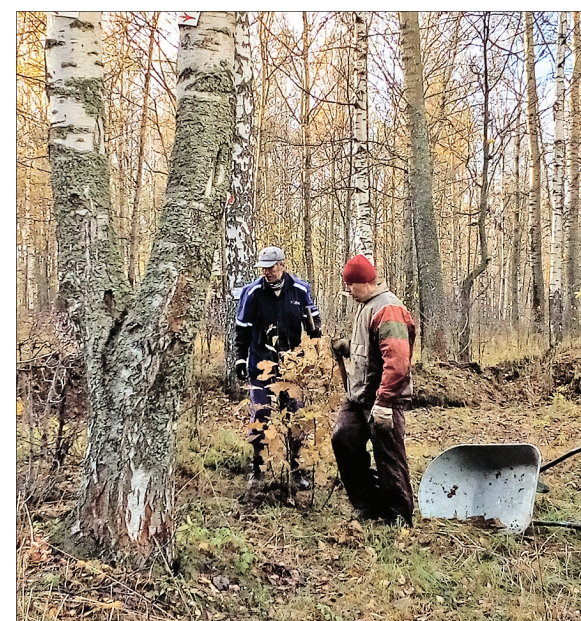
Эта трасса зимой очень популярна в народе.