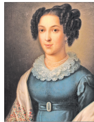
Портрет неизвестной. XIX век.

Реставрационная комиссия осматривает картины и в случае необходимости приводит в порядок. Следующий шаг подготовки к выставке — подбор «нарядов»: для картин подбираются новые рамы или реставрируются ста-