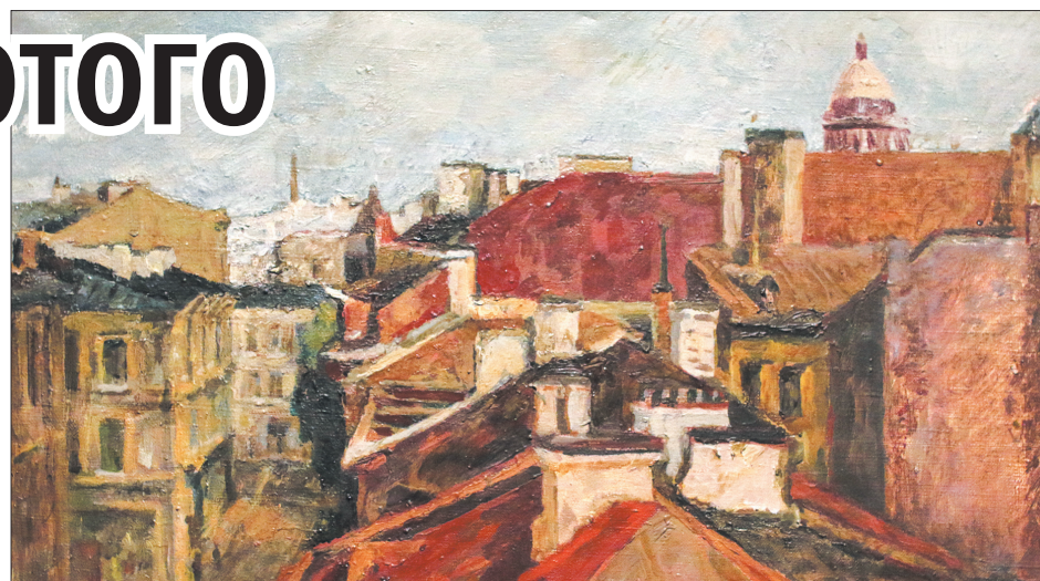
П.М. Кондратьев. «Крыши Ленинграда».

крытые фонды» посетители музея могут увидеть, как это выглядит, как существуют в хранилище различные произведения искусства.