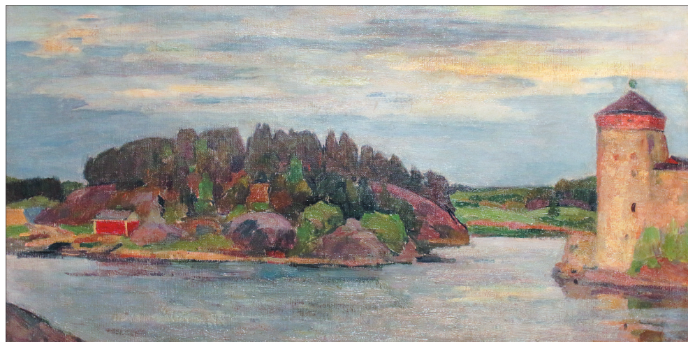
О.Э. Браз. «Замок Олофсборг».

В будущем году Ярославскому художественному музею исполнится 100 лет. В честь этой даты в музее проходит проект «Открытые фонды». Первая выставка — «Стеллаж № 4» — открывает для ценителей прекрасного произведения русских художников XVIII — начала XX века.