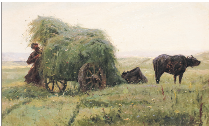
В. Максимов. «Убока сена».