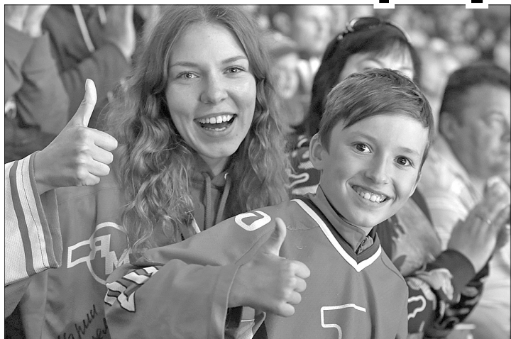
Встреча с болельщиками.

Представление новичков, конкурсы и призы для фанатов, матч с соперником, которым в этом году стала череповецкая «Северсталь», — в этот раз было все то же самое, только одно, но очень весомое отличие. Пришедшие на игру болельщики впервые увидели хоккеистов в новой форме. Игровые свитера «Локомотив» не менял восемь сезонов, но теперь пошел на изменения, добавив к красному и синему цветам еще и золотистый.