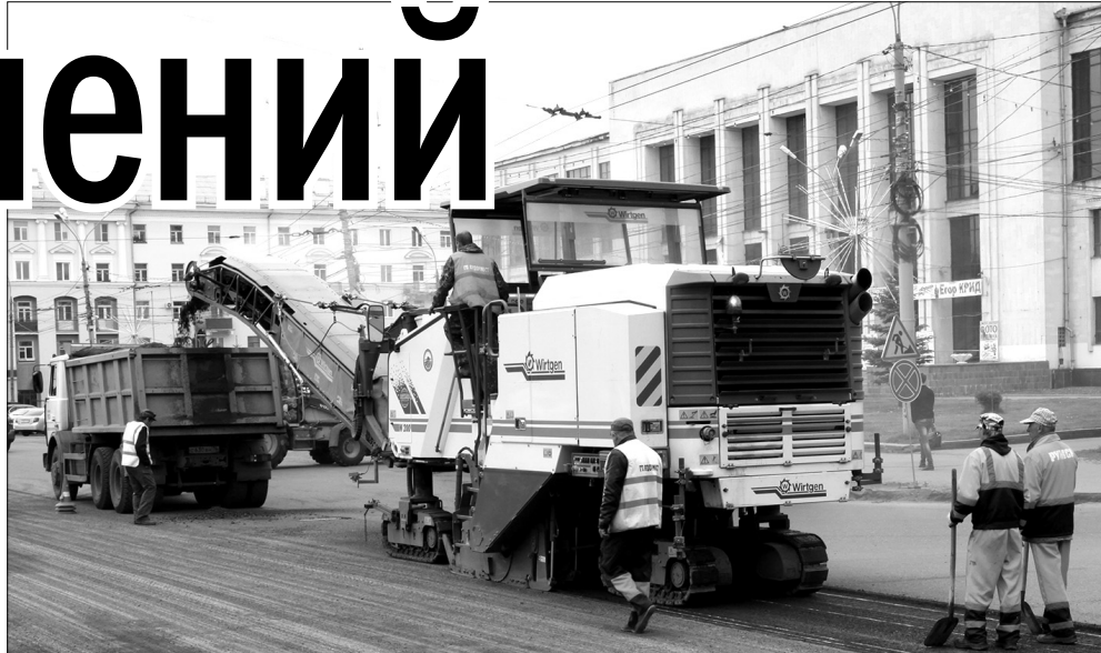
Ремонт Юбилейной площади.

Первый сад, на 220 мест, был торжественно открыт в День города, 27 мая, в Дзержинском районе. Еще два, расположенные в