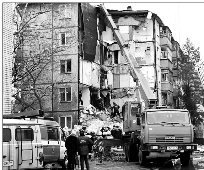
Пострадавший в результате взрыва газа дом на улице 6-й Железнодорожной.