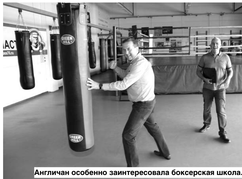
Англичан особенно заинтересовала боксерская школа.