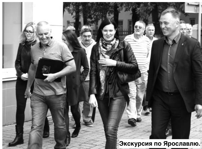
Экскурсия по Ярославлю.