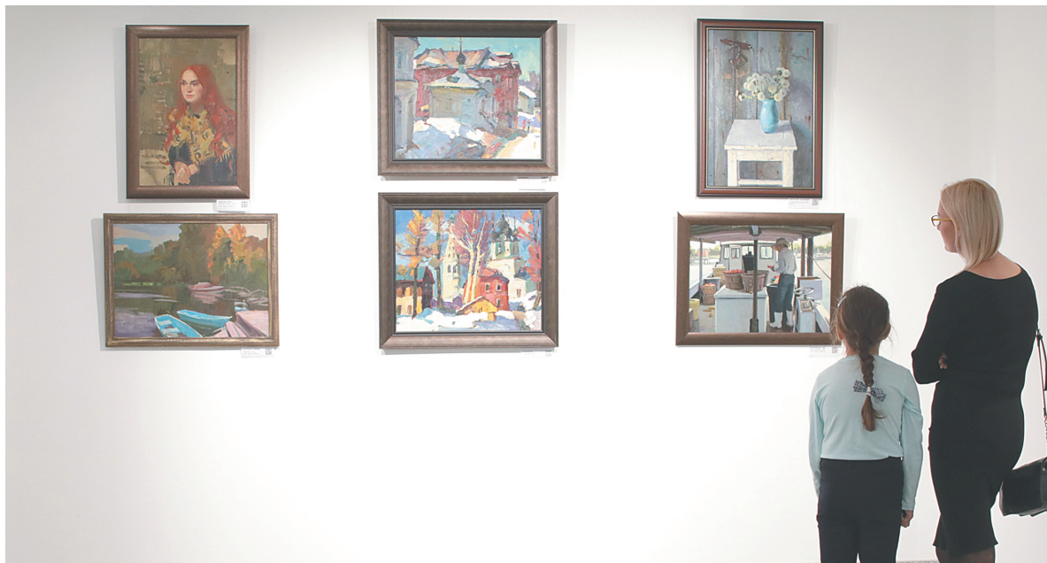
↓ На выставке.

В «Грачах», как с любовью прозвали костромской пленэр художники, принимают участие академики и члены-корреспонденты Российской Академии художеств, заслуженные и народные, просто талантливые живописцы. Изначально выезд на пленэр проходил раз в год, весной. Но количество желающих так выросло, что организаторы решили проводить его и осенью тоже. За несколько лет на костромском пленэре побывали более восьмидесяти художников из России, США и стран СНГ. Так появилась выставка живописи, пронизанная общей