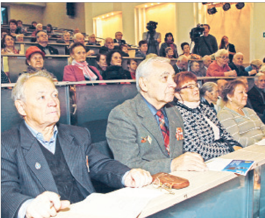
Ветеранам предложили заполнить анкеты со своими замечаниями, предложениями и вопросами.