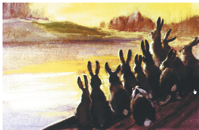
Работы художника Олега Новозонова стали основой для великолепного диафильма.