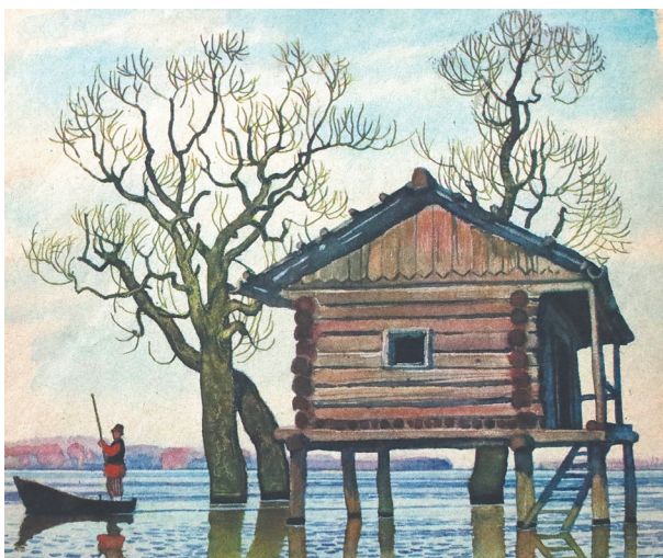
Иллюстрация Леонида Кузнецова. «Всю эту местность вода поднимает, так что деревня весной всплывает».