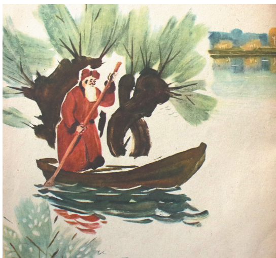
Иллюстрация Николая Пшинки.