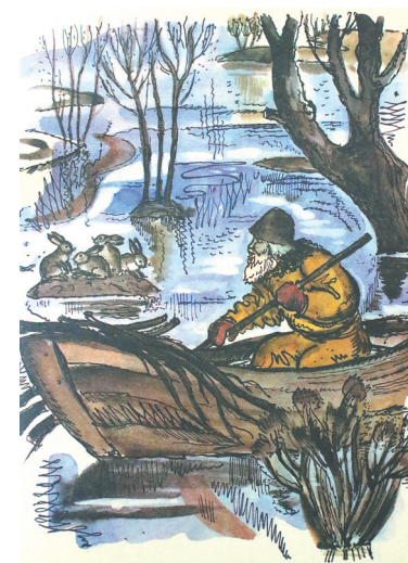
Иллюстрация Елены Лось (Минск).

Обладающий тонким вкусом и исторической эрудицией художник сотрудничает с книжными издательствами с 1992 года. В 2013-м Игорь Сакуров стал обла-