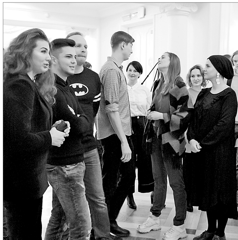
Творческий союз: актеры и авторы.

«Один к десяти. Театральные портреты» — так называется книга, посвященная актерам Волковского театра