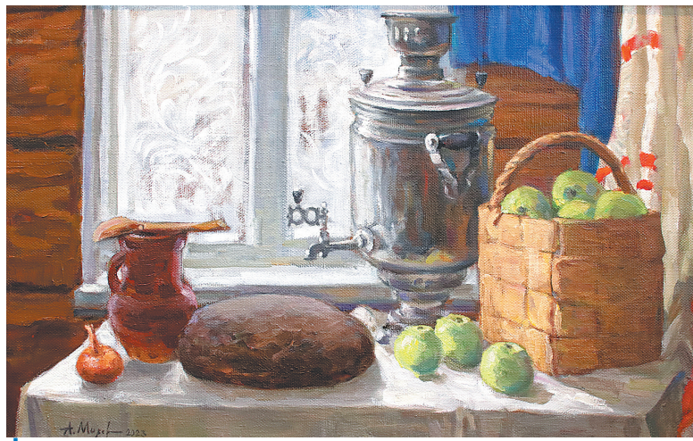
«У зимнего окна».