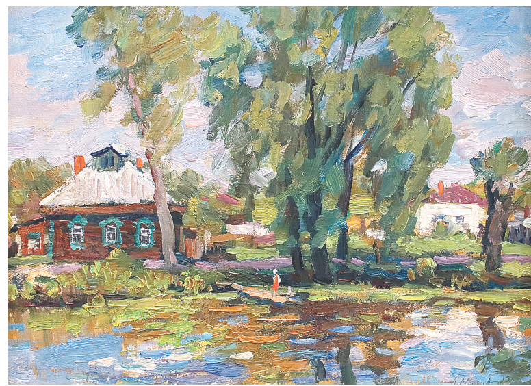
«Жаркий день. Переславль».

привозил яркие впечатления и новые эмоции.