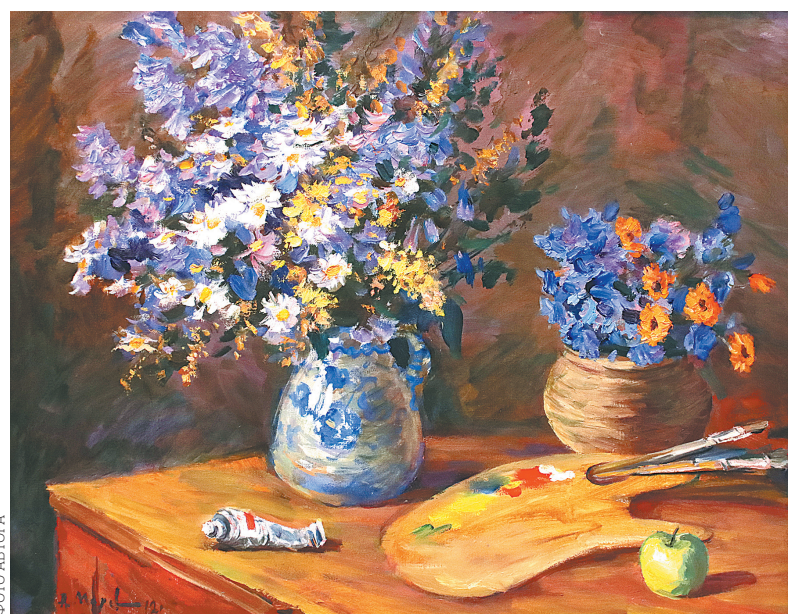
«Цветы и палитра».