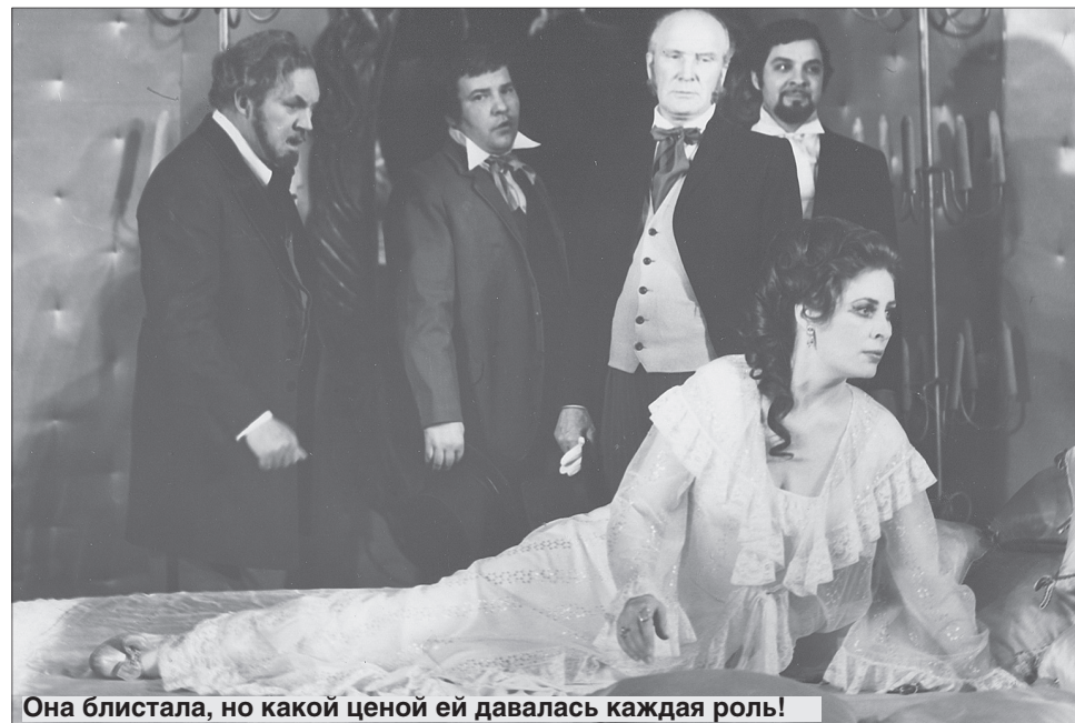
Она блистала, но какой ценой ей давалась каждая роль!