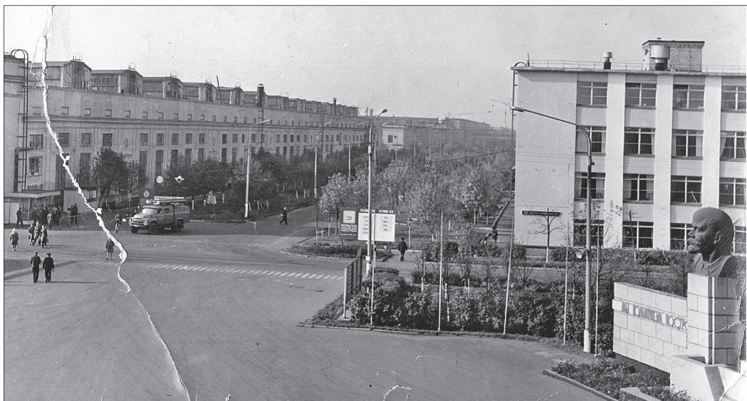
Так выглядел моторный завод в 1967 году.

15 АПРЕЛЯ ИСПОЛНИЛОСЬ БЫ 100 ЛЕТ АНАТОЛИЮ МИХАЙЛОВИЧУ ДОБРЫНИНУ, ДИРЕКТОРУ ЯМЗ И ПО «АВТОДИЗЕЛЬ» В 1961 — 1982 ГОДАХ