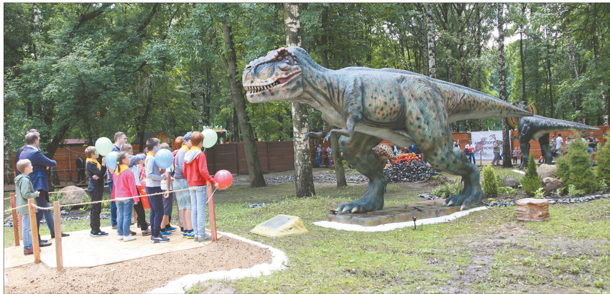
Тираннозавр Рекс предстал перед детворой в полный четырехметровый рост.

тот же брахиозавр вытеснил бы в этом случае из парка не только своих древних конкурентов,