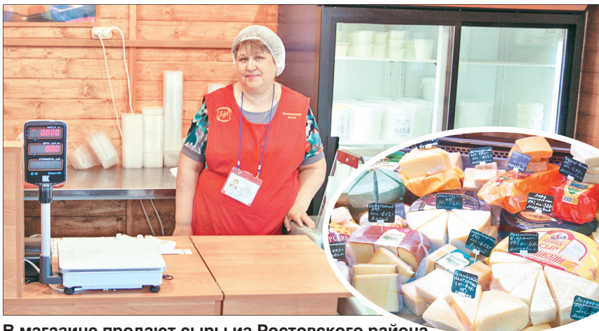
В магазине продают сыры из Ростовского района.