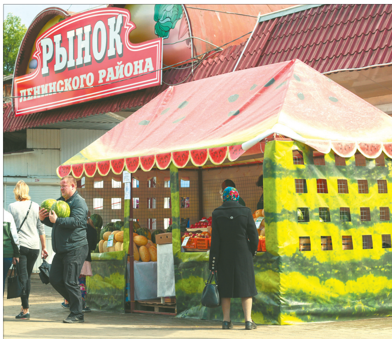
Палатка для продажи бахчевых и фруктов.

На улицах Ярославля появились 25 торговых палаток в виде аппетитного спелого арбуза. Продаются в них не только гигантскую ягоду.