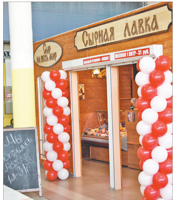
В день открытия.