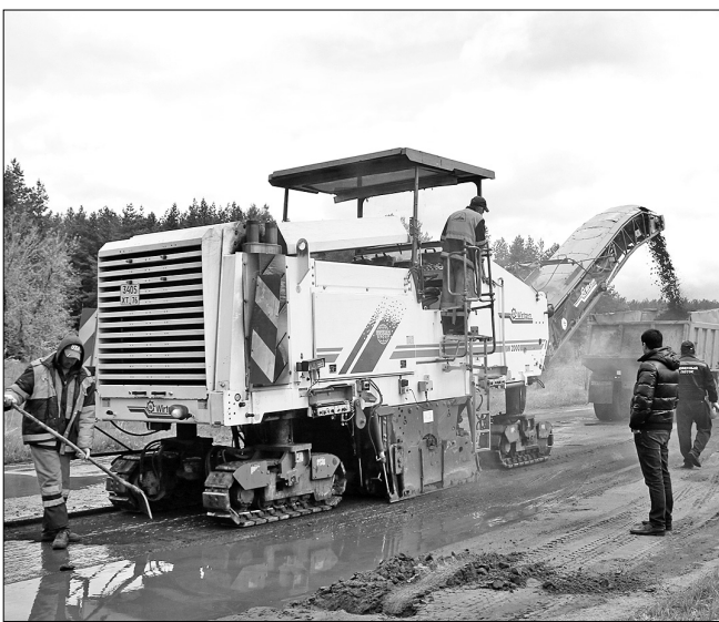
После фрезерования асфальта полученную крошку отправляют на дороги частного сектора.

В Заволжском районе подготовка дорог к карточному ремонту идет на улицах Борки и Новое Долматово. Ремонт дорог на окраинах — это одно из главных направлений в программе развития нашего города.