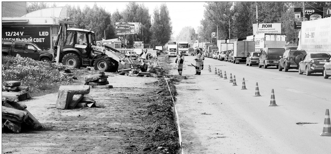
На Юго-Западной окружной дороге работы начались.