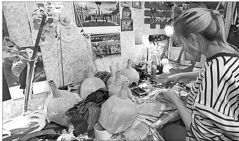
В бутафорском цехе идет работа над новым спектаклем.

Дальше наш путь лежит туда, куда зрители обычно не заглядывают, – за кулисы.