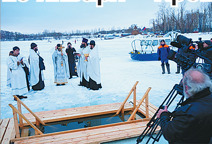
При устройстве иордани особое внимание обращается на безопасность.

В этом году организаторы крещенских купаний опасаются недостаточной толщины льда и просят всех, кто собирается купаться в иордани, обратить особое внимание на условия безопасности. Мы публикуем места организованного купания в Ярославле.