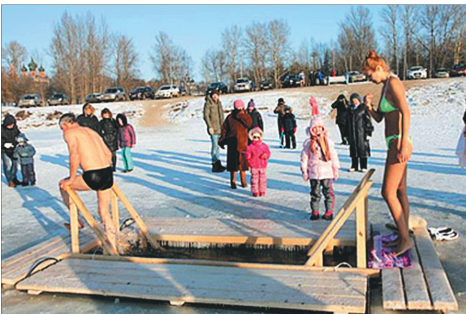
Иордань на реке Которосль.