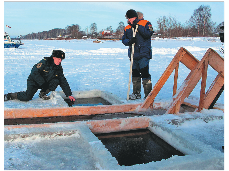
В этом году толщина льда вызывает опасения.

В этом году организаторы крещенских купаний опасаются недостаточной толщины льда и просят всех, кто собирается купаться в иордани, обратить особое внимание на условия безопасности. Мы публикуем места организованного купания в Ярославле.