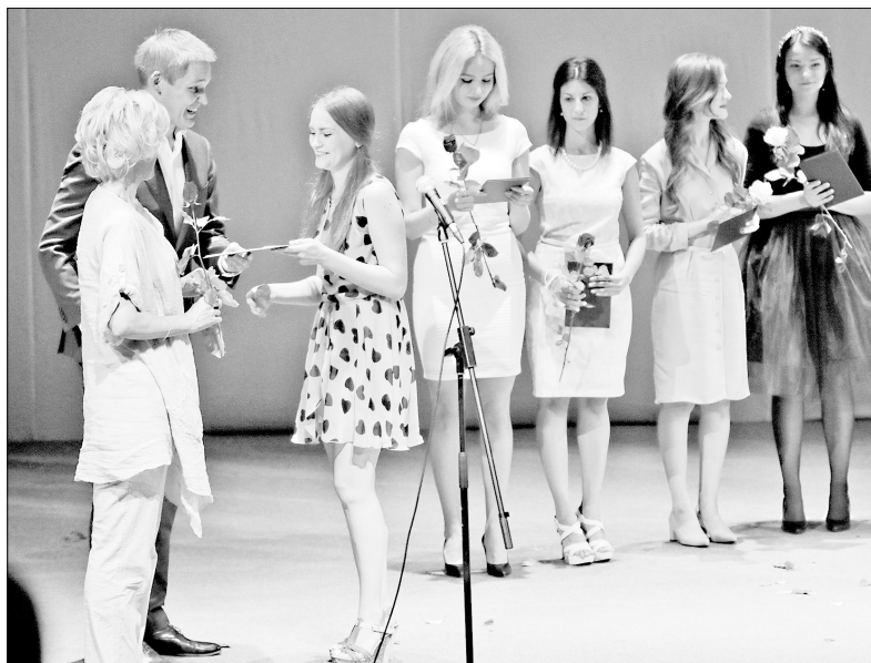
Будущие педагоги получают красные дипломы.

Лучшие выпускники Ярославского государственного педагогического университета имени Ушинского собрались 30 июня в Театре юного зрителя. Поздравить их с успешным окончанием вуза и вручить дипломы с отличием пришли руководители города и области.