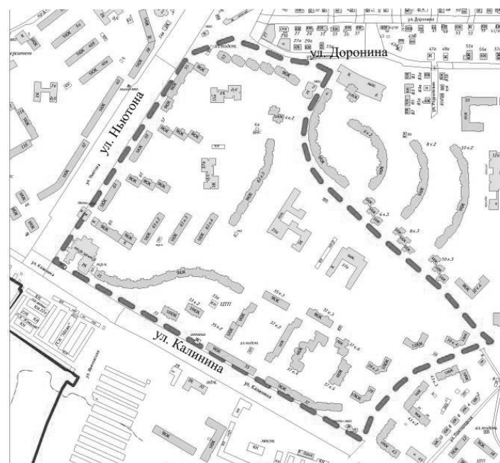
Схема границ территории, ограниченной ул. Калинина, ул. Ньютона, ул. Доронина во Фрунзенском районе города Ярославля

— — — — граница территории для подготовки проекта межевания.