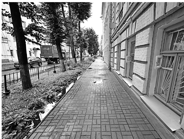
На улице Максимова тротуары вымощены специальной плиткой.

позволило увеличить срок службы дорожного полотна. А на улицах Суркова, Максимова, Пушкина тротуары вымостили специальной плиткой. В результате пешеходная часть стала ровной и смотрится более современно. Отзывы ярославцев – положительные.