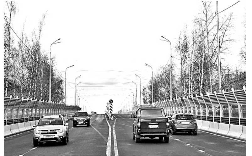
Движение по правой стороне разрешено.

– Мы получили положительное заключение экспертизы и не стали тянуть со сроками – открыли движение по путепроводу. В течение года шел активный ремонт, подрядная организация проделала огромную работу. Сейчас мост соединил два района Ярославля – Ленинский и Дзержинский. Еще остаются некоторые вопросы