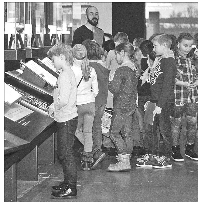
Детей учат толерантности.

Особый город в истории российского еврейства — Одесса. Когда в 1792 году русские войска взяли турецкую крепость Хаджибей и основали там Одессу, Екатерина II решила как можно быстрее заселить город. Возникла идея переселить сюда польских евреев. Так Одесса стала «еврейским» городом. Об этом рассказывается в зале, воссоздающем атмосферу одесского кафе конца XIX века. Сев за сенсорный столик, можно прямо на нем посмотреть фильм о проблемах, волновавших умы евреев того времени.