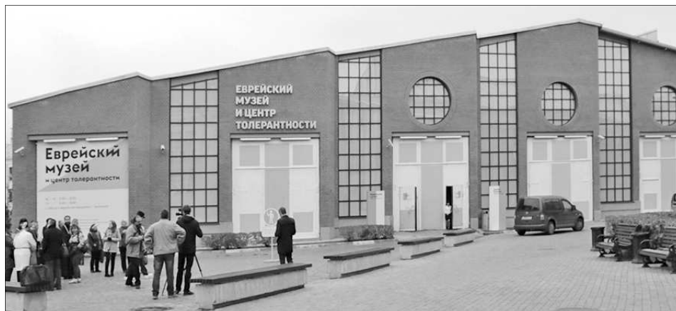
Еврейский музей и центр толерантности в Москве.

6 октября журналисты «Городских новостей» побывали в Еврейском музее и центре толерантности на выездном семинаре «Общегражданское единство и этноконфессиональные диалоги в информационном пространстве».