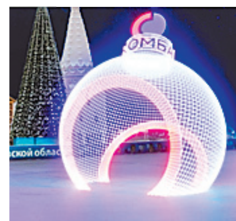
↓ Декоративная конструкция «Шар».