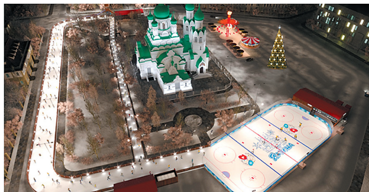
↓ Каток максимально отодвинут от главного фасада церкви Ильи Пророка.