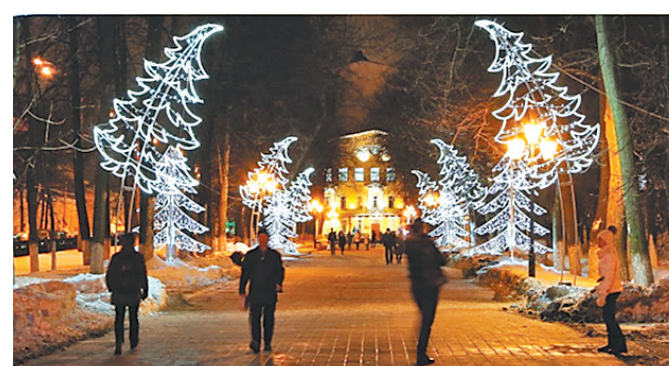
↓ Первомайский бульвар.

« Напоминаем, что в Ярославле продолжается конкурс «Арт-елка». Сделать необычную елку и представить ее на суд жюри может любой житель Ярославля. В фантазии себя можно не ограничивать: объект может быть объемным или плоским, высотой от 100 см до 2 метров. Конкурс «Арт-елка» продлится до 25 января.