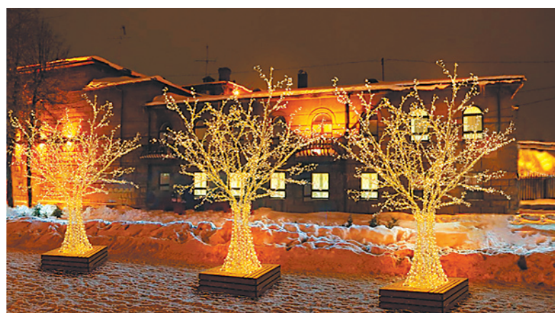
↓ Световые деревья на Богоявленской площади и на бульваре на пр. Ленина.