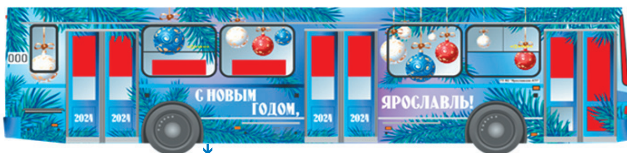
↓ Вот такой общественный транспорт будет ездить по Ярославлю.