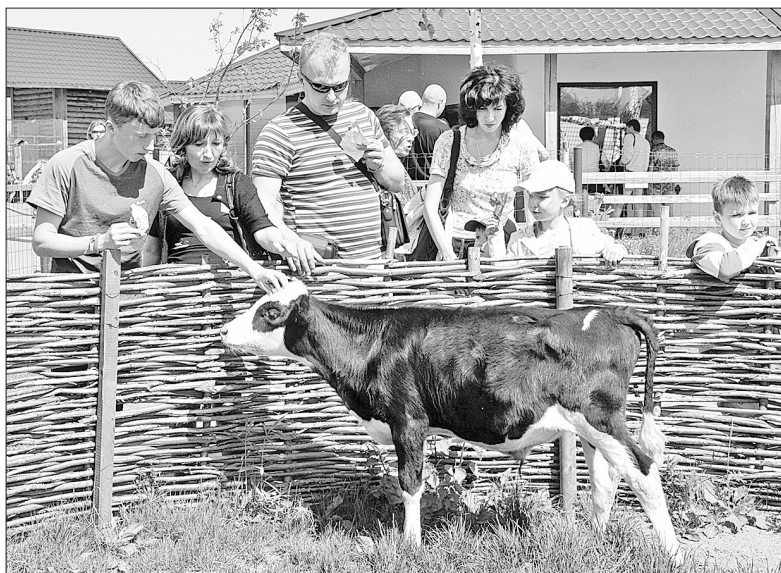
Посетители зоопарка нередко подкармливают животных запрещенными продуктами.

Если надо осмотреть животное, защитить ему рану, зверю дают наркоз. Для этого есть специальное оборудование. Так что ветеринары не цирковые смельчаки-дрессировщики.