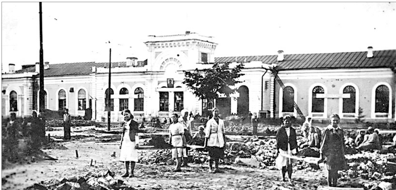
Под бомбовые удары попали многие предприятия и вокзалы Ярославля.

Из ярославской военной хроники 1941 – 1945 гг.