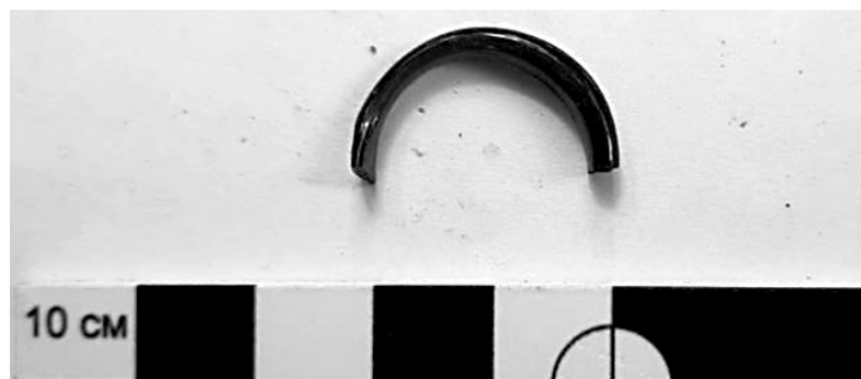
Фрагмент синего стеклянного перстня - начало XIII века.