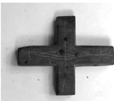
Крест сланцевый нательный - XIV век.