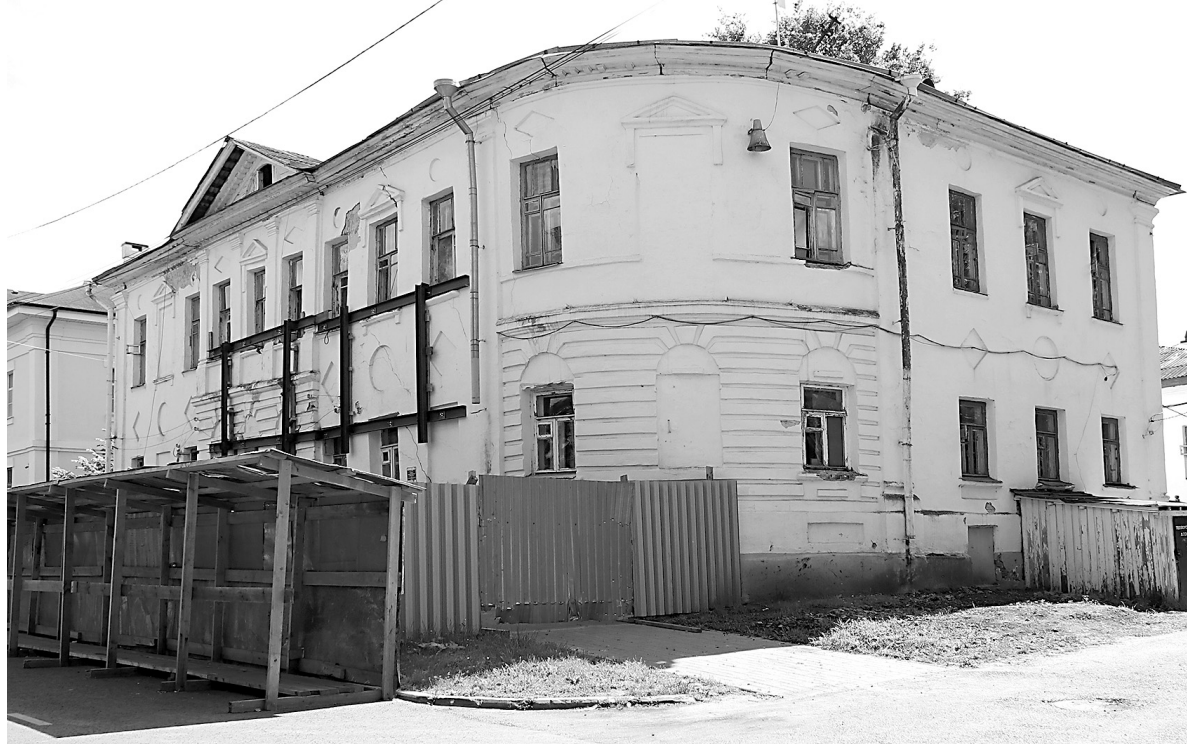
пл. Челюскинцев, 7

Например, обнаружили интересный объект – небольшой сланцевый крест. Подобные кресты называют курсунскими по месту производства – Курсуни. На кресте видна аккуратная дырочка, в которую продевался шнурок для ношения – можно