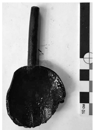
Фрагмент ложки деревянной - начало XIII века.

вновь демонстрирует важность археологических исследований при реставрации объектов культурного наследия.