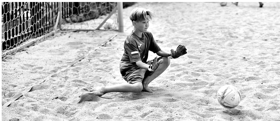
Играть в футбол на пляже непросто.

После открытия состоялись мастер-класс от чемпиона мира и товарищеская игра, в которой приняли участие футболисты спортшколы и дети детской инклюзивной футбольной школы «СТЕП футбол». ■