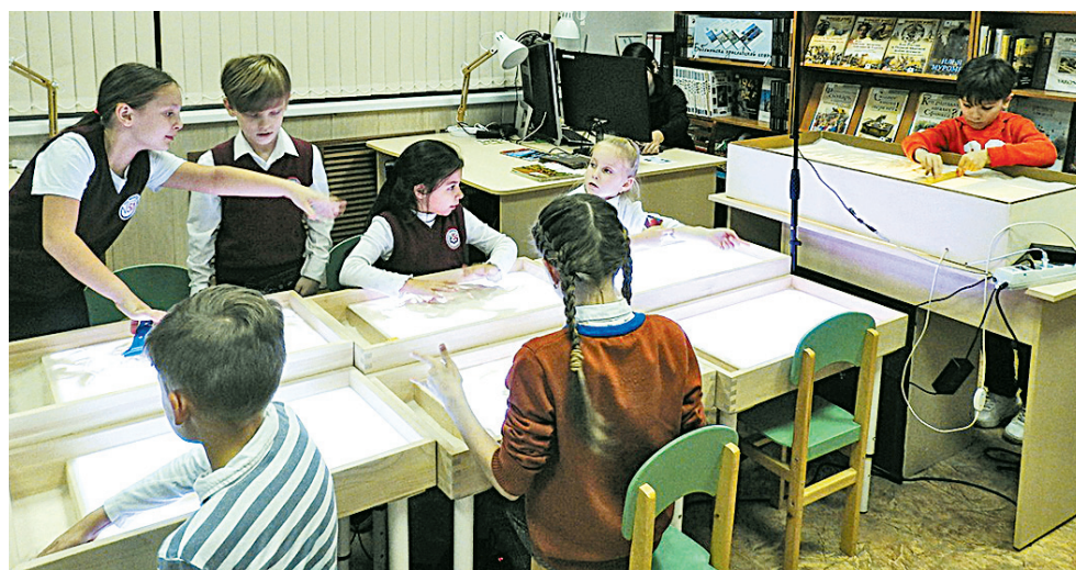
В студии песочной анимации.

В последних числах октября в Центральной детской библиотеке имени Ярослава Мудрого состоялся праздник «YARik к нам пришел!», посвященный открытию одноименной студии дополненной реальности.