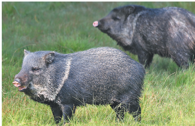
Пекари не прочь попозировать.