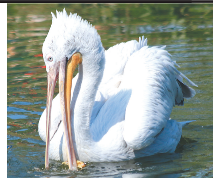
Водоплавающим жара не страшна.

ЗООПАРК В ЦИФРАХ Официальное открытие Ярославского зоопарка состоялось 20 августа 2008 года, то есть сегодня он работает 5 474-й день. Среди его обитателей есть представители 5 континентов мира. Здесь содержатся 402 вида животных, всего 3 263 особи. Среди них 129 видов – краснокнижные.