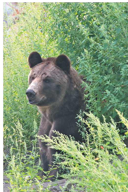
Медведь спрятался в зарослях лебеды.