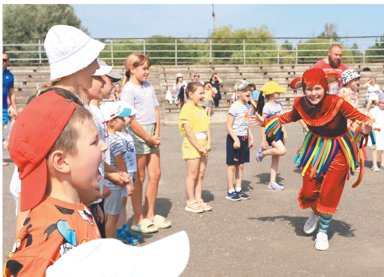
И на пиратской вечеринке, и на пенной дискотеке было весело всем – от мала до велика.