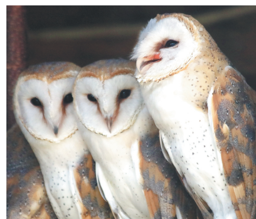
Сонные сипухи скрылись в тени вольера.