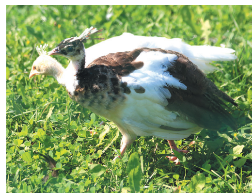
Птенцы павлинов позже станут украшением зоопарка.