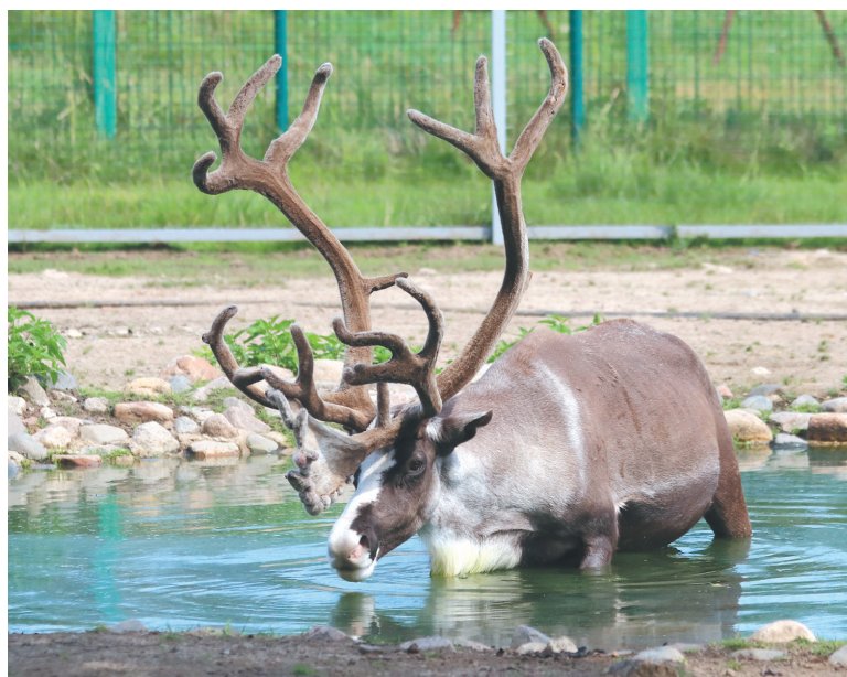
Северный олень спасается от солнца в воде.