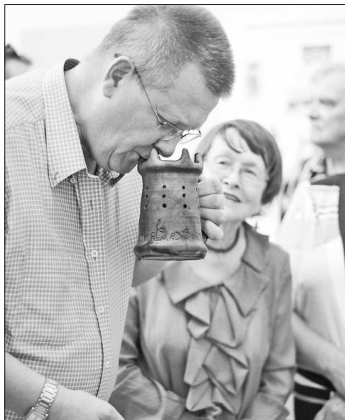
Кружка с секретом.