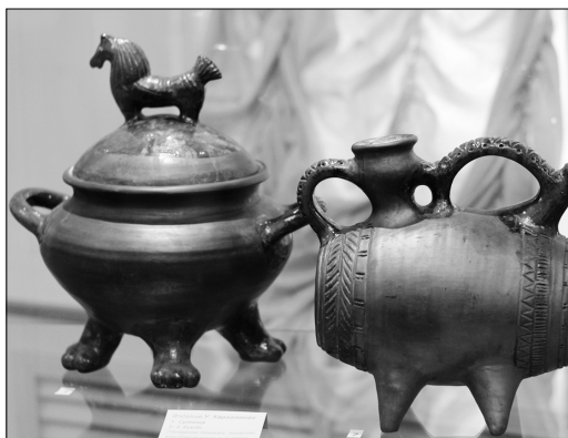
У. Каражанов. Супница и кухля.