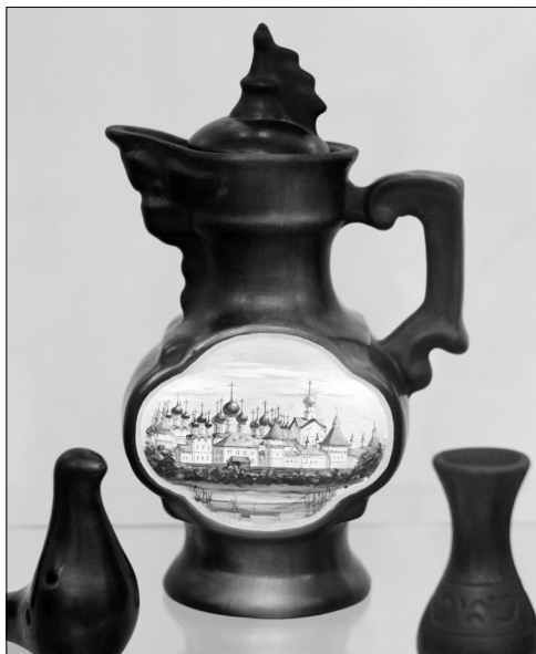
Мастерская А.И. Шабалова. Кувшин.