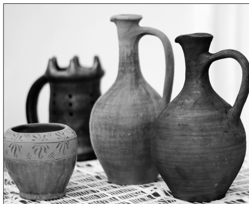
Изделия восхищают гармонией пропорций.