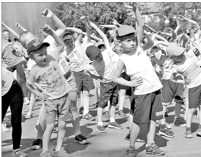
Упражнения на плечевой пояс.

«Ярзарядка» полюбилась маленьким ярославцам. К 9 часам утра в сквере на площади Мира уже яблоку негде было упасть. Не каждый день утро начинается с зарядки с чемпионом! Несложные упражнения под бодрую музыку