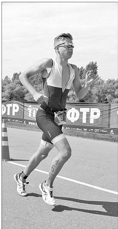
Бег – всему голова.

В минувшие выходные в центре Ярославля проходил чемпионат и первенство России по летнему триатлону.