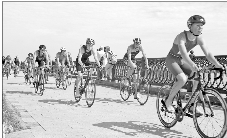
Вместе весело крутить против ветра.

Погода в субботу выдалась довольно благоприятной для тех, кто в одном старте сочетает плавание, велогонку и бег. Температура воздуха, правда, уже к полудню поднялась до 28 градусов, зато вода в Волге прогрелась до 21, что позволило организаторам отказать спортсменам в применении гидрокостюмов. Это уравнило шансы триатлонистов на первом, определяющем, сегменте соревнований – плавании. Велогонка прошла по Волжской набережной, а бег – по Которосльской и на самой Стрелке. Трасса получилась довольно компакт-