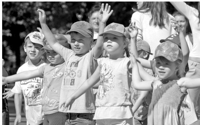
«Ярзарядка» полюбилась маленьким ярославцам.