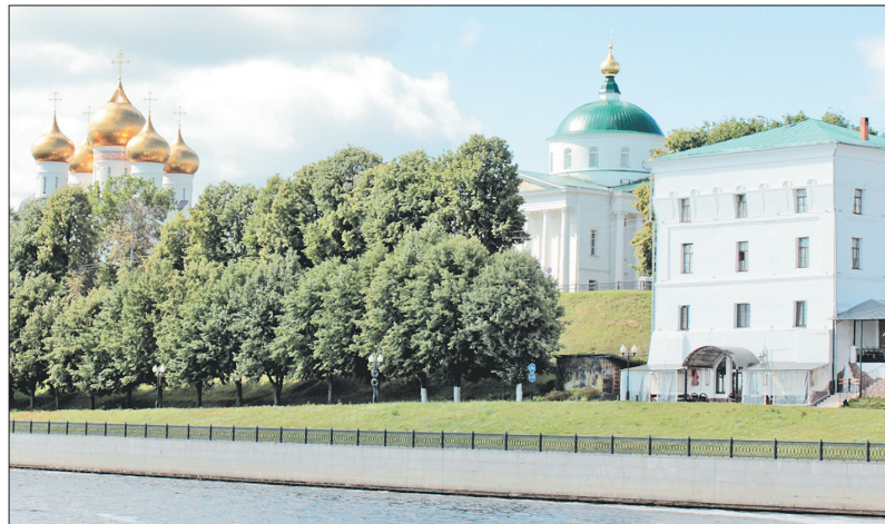
Арсенальная башня на Волжской набережной.