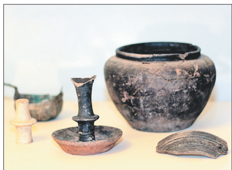
Эти экспонаты можно увидеть в музее.