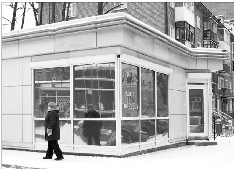
Новый магазин у Угличского рынка.