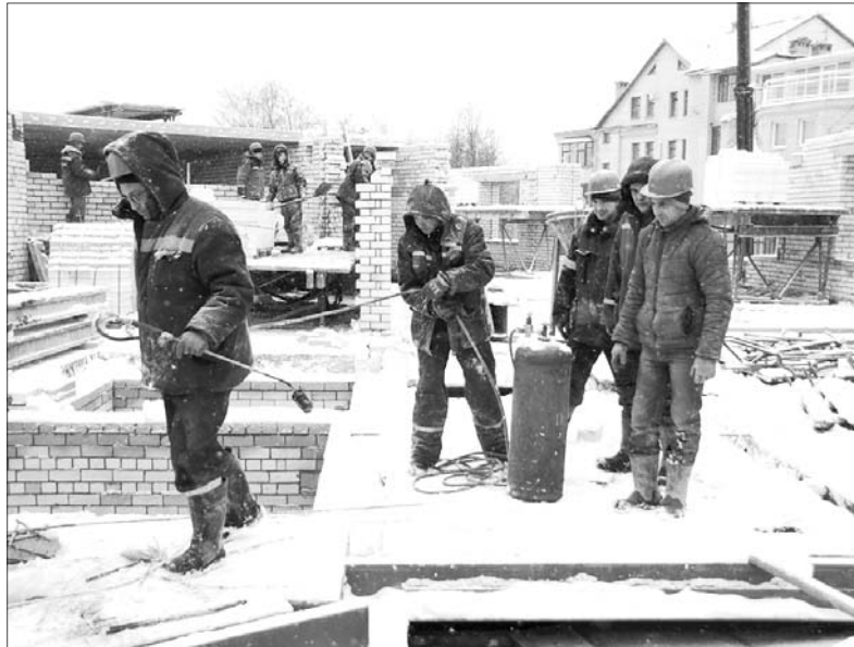
Завершить работы по кровле планируется в начале следующего года.

Процесс возведения пристройки к школе № 43 идет по графику. Такой вывод сделали областные власти, посетив в конце ноября строительную площадку.