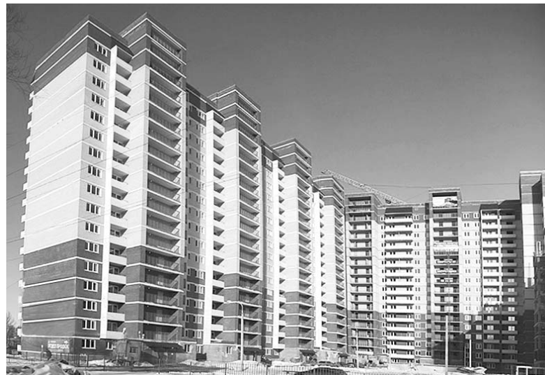
К Новому году строители готовятся сдать 106 тыс. кв. м жилья.

Речь идет о тех домах, которые уже построены. Вопросов с их сдачей, по сути, всего два.