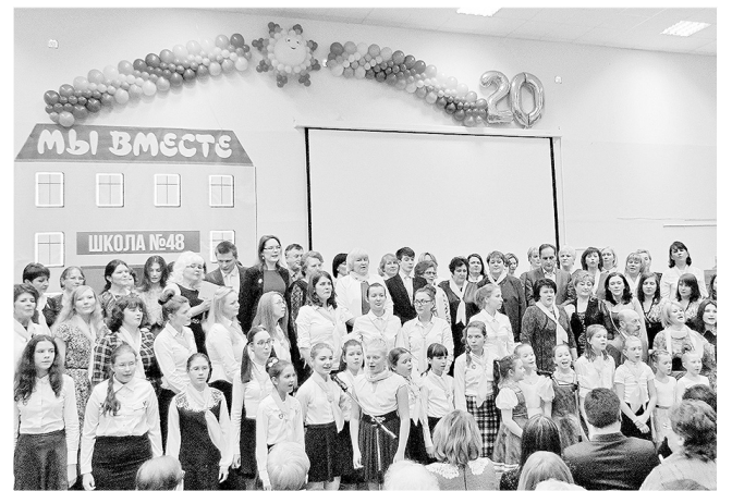
На юбилейном конкурсе.

Двадцать лет назад в Заволжском районе Ярославля распахнула двери новая современная школа № 48.