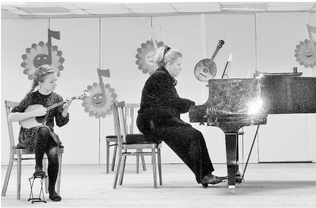
Юная исполнительница с аккомпаниатором.

В конце февраля в ярославской детской школе искусств № 10 состоялся первый городской фестиваль-конкурс юных исполнителей на домре «Поющая струна».