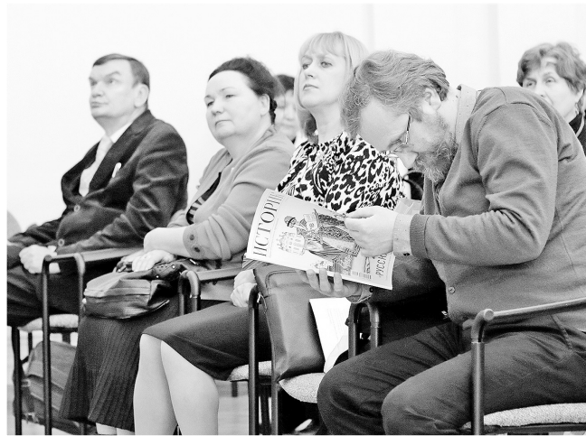
На открытии конференции в Большом зале мэрии.

В рамках конференции в музеях, библиотеках и школах города проходят библиографические игры, презентации книг, краеведческие квесты. В библиотеке имени Ярослава Мудрого про-