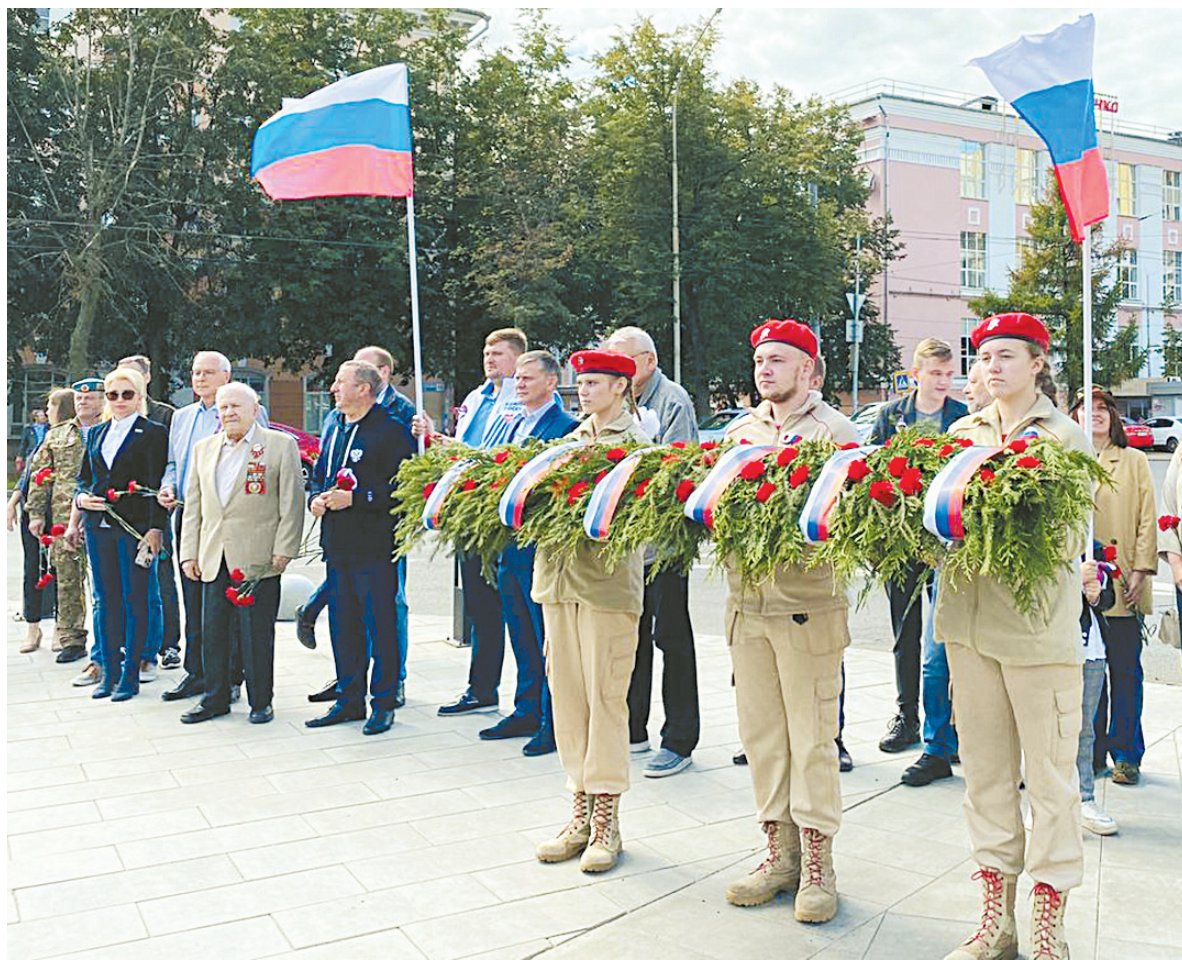
Участники автопробега возложили цветы и венки к памятной стеле «Ярославль – город трудовой доблести».

– В дни, когда наша страна особенно нуждается в том, чтобы ее граждане проявляли сплочение и единение, государственные праздники привлекают большое внимание и интерес. Нельзя за-