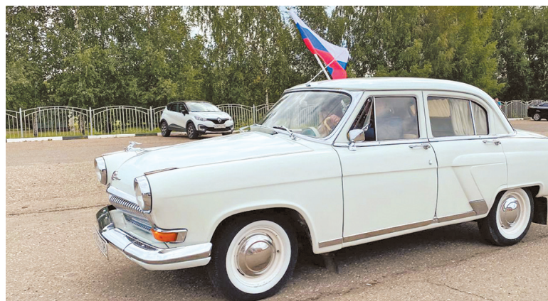
Ретроавтомобили с триколором проехали по центру города.

Читайте «Городские новости» в социальных сетях