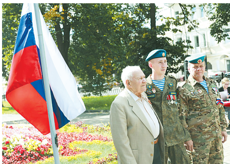
К поднятию флага готовы!