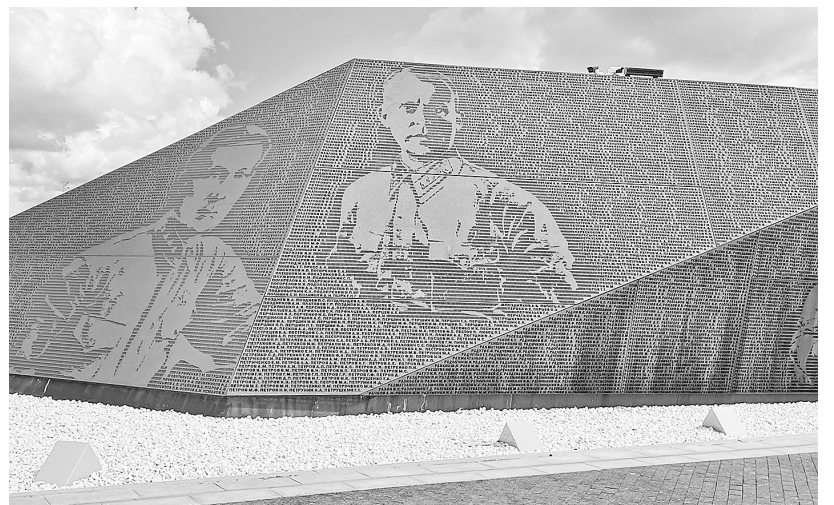
↓ Фрагмент мемориала Советскому солдату подо Ржевом.