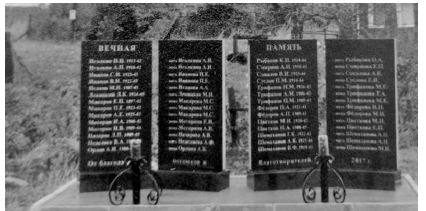
↓ Памятник погибшим землякам в деревне Осташево.