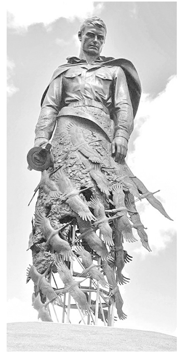
↓ Памятник Советскому солдату подо Ржевом.