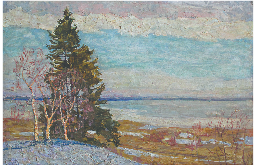
«Плещеево озеро». 1959 год.