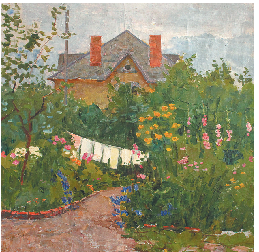
«Двор». 1955 год.