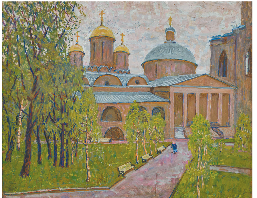
«Спасо-Преображенский монастырь. Ярославль».