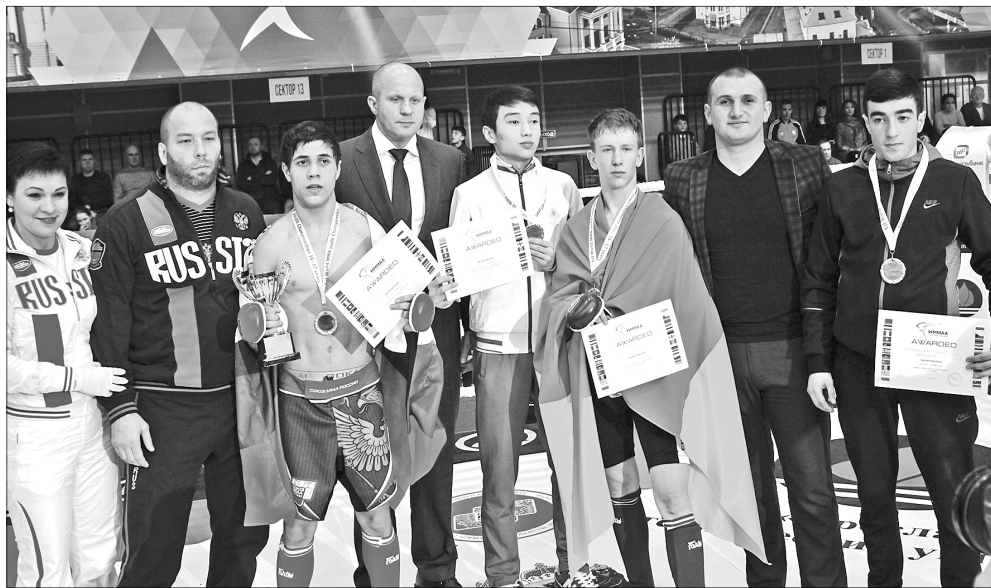
Федор Емельяненко (в центре) с участниками первенства.

ители MMA провели в Ярославле, были озвучены основные принципы стратегии развития этого вида спорта. Союз MMA выстраивает систему подготовки молодых спортсменов. Сегодня проведена большая работа по формированию правил в детских и юношеских смешанных единоборствах с целью подготовки резерва для взрослой сборной. Сейчас такие правила утверждены, что позволило начать прове-