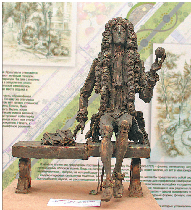
Эскиз памятника Исааку Ньютону Е. Пасхиной.

Как в уютно обустроенной квартире, чувствуешь себя на выставке декоративно-прикладного искусства «Арт-объекты», открывшейся в зале Ярославского отделения Союза художников России на Максимова, 15.