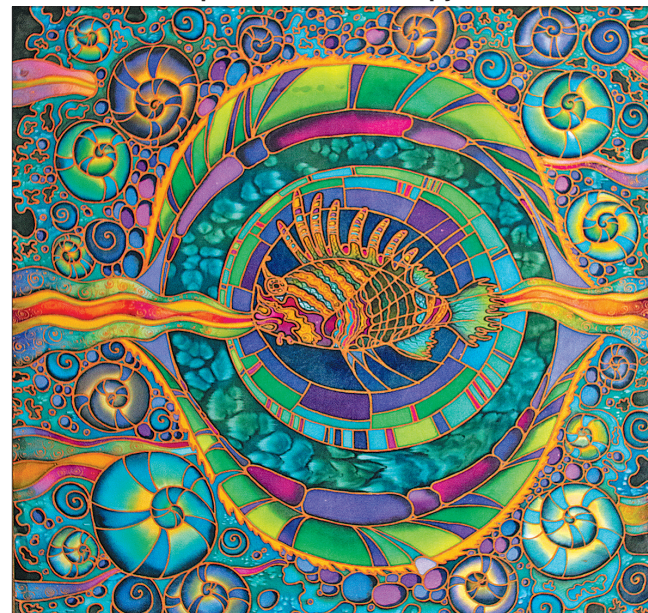
О. Пастухова. «Рыба».