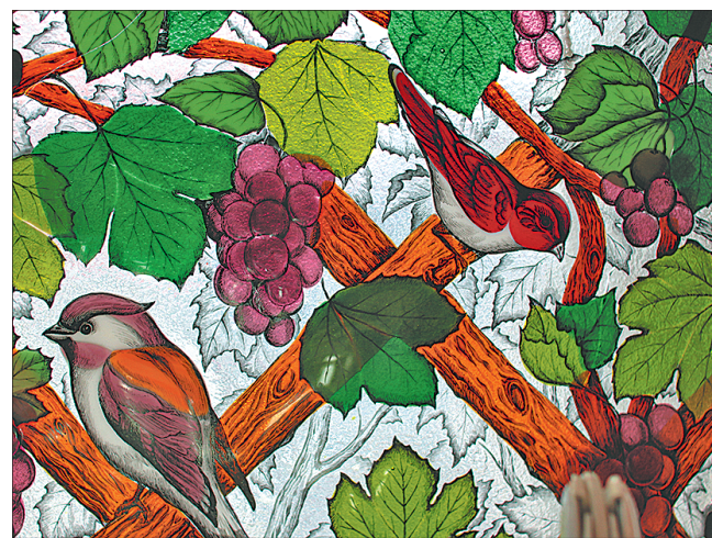
И. Галицкий. «Райский сад».