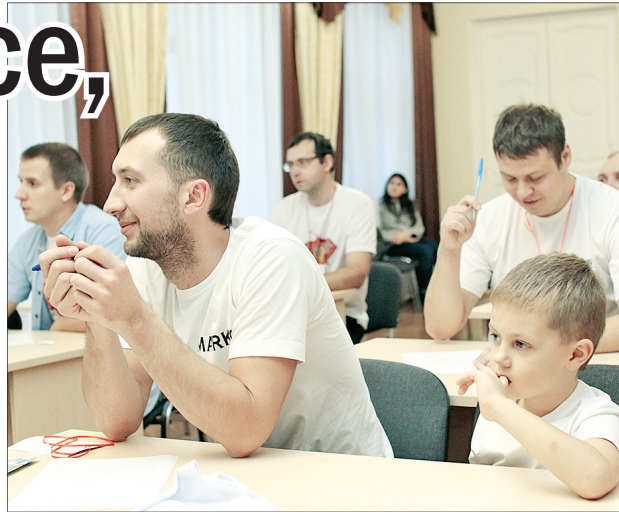
Папам пришлось сесть за парты.

Это доказали финалисты городского конкурса «Супер-папа», который прошел 18 ноября в городском Центре патриотического воспитания. За звание самого лучшего отца Ярославля боролись девять претендентов.