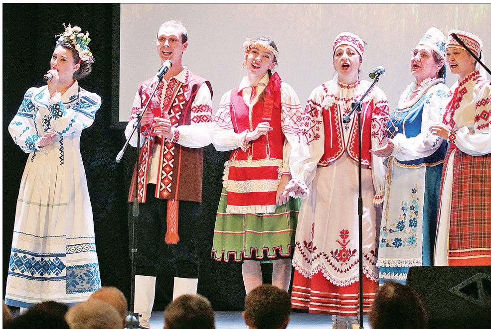
Ансамбль белорусской песни «Криница».