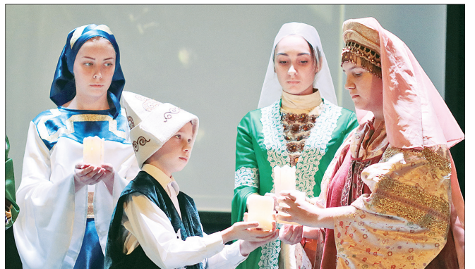
Поздравление от регионального отделения Ассамблеи народов России.

тров. – Проекты объединения имеют социальную направленность, они способствуют духовному и нравственному развитию подрастающего поколения.