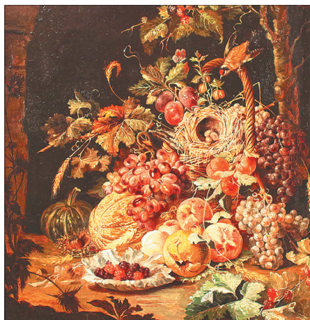
Иоганн Баптист Халсзель. «Осенний натюрморт с овощами, фруктами и гнездом».

Здесь можно узнать, что есть натюрморты роскошные, и это не эпитет, а термин. «Роскошные», «охотничьи», «ученые» или «философские» натюрморты в аллегорической форме повествуют о бренности земной славы, о человеческой жизни и вечности искусства.