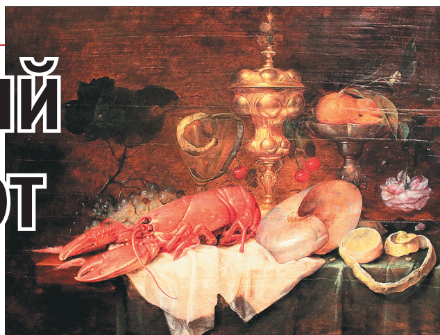
Ян Франс ван Сон. «Натюрморт с омаром и наutilusом».