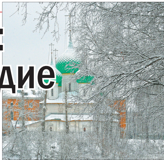
Храм Николы в Меленках.

На конференции были представлены серия фотографий чле-