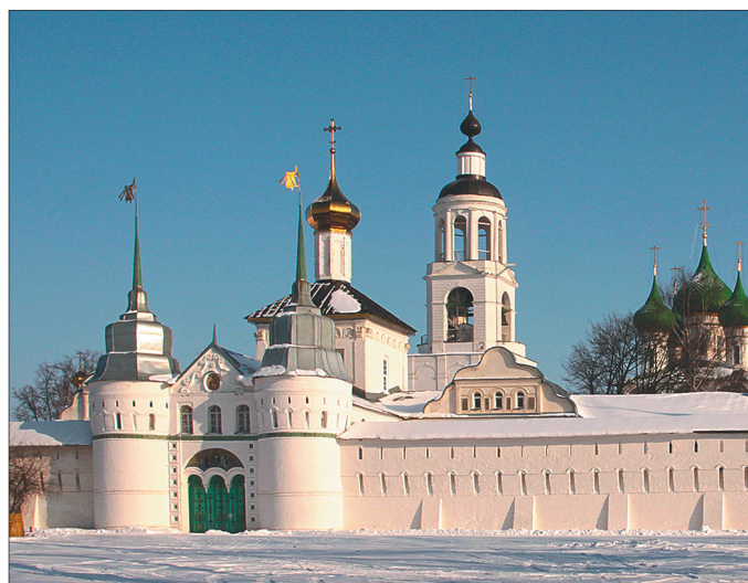
Святые ворота с Никольской надвратной церковью. Толгский монастырь.