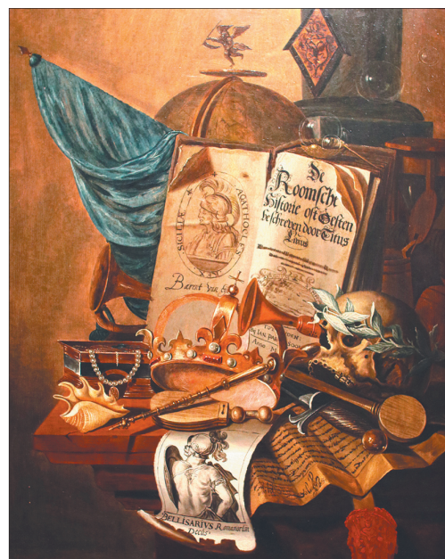
Эварт Колье. «Суета сует».

Роскошные «Натюрморт с фруктами и омаром на столе» кисти Петера ван Оверсхе и «Натюрморт с омаром и наutilusом» Яна Франса ван Сона — это мир символов, в котором можно разбираться бесконечно. И здесь в помощь расширенные аннотации — о каждом живописном