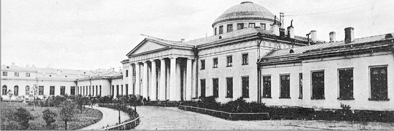
Здание I Государственной думы.

Таврический Дворецъ-Здание Государственной Думы. Le Palais de Tauride - Douma de l'Empire.