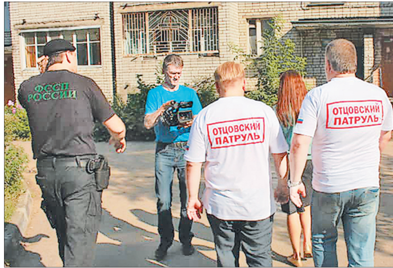
Совместный рейд Отцовского патруля и УФССП России.

ципальных образованиях нашей области. Совет объединяет активных мужчин, которые на общественных началах готовы ре-