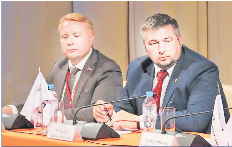
Первое заседание Совета отцов Ярославской области.