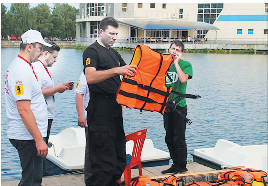
Отцовский патруль в действии.

— Это еще одна из задач успешных отцов. Проведение правозащитной и общественной деятельности, направленной на недопустимость любых форм разрушения и дискриминации родительства (отцовства и материнства) и детства, крайне необходимо. Безусловно, все это нужно делать в тесном взаимодействии с образовательными организациями, традиционными российскими религиозными организациями, СМИ, органами власти и институтами гражданского общества. Повторюсь, наша главная цель — воспитание счастливых, духовно-нравственных детей. Ради этого понятие «отцовство» необходимо всячески пропагандировать, укреплять и расширять представление детей о роли отца как носителя и хранителя семейных ценностей.