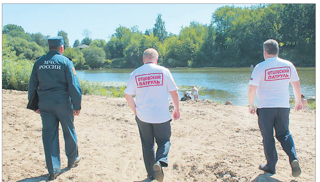
Проверка несанкционированных мест купания.