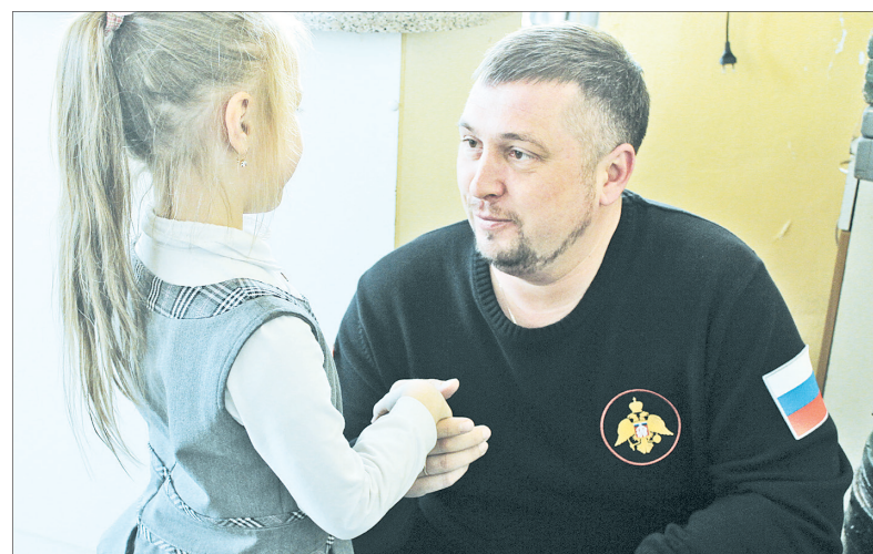
Михаил Крупин умеет найти подход к каждому ребенку.

Председатель комитета Ярославской областной думы по образованию, культуре, туризму, спорту и делам молодежи, председатель Ярославского област-