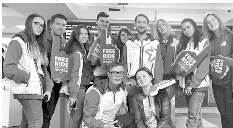
Наша дружная смена.