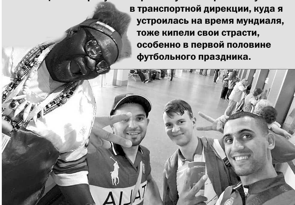
Болельщики бывают разные.

15 июля завершился чемпионат мира по футболу, проходивший в России. Захватывающие игры, эмоции футболистов, слезы радости и разочарования видели болельщики на трибунах и зрители у телеэкранов. А у нас в транспортной дирекции, куда я устроилась на время мундиаля, тоже кипели свои страсти, особенно в первой половине футбольного праздника.