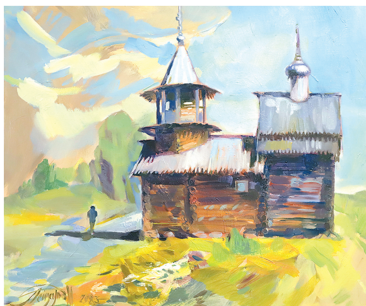
«Часовня архангела Михаила. Кижь».