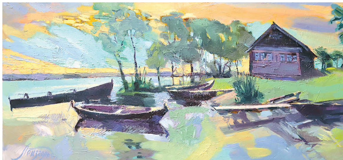
«Северное лето. Остров Кижь».

Ощутить красоту русской природы и прикоснуться к нашей истории могут гости Музея истории города Ярославля. Здесь 21 марта открылась персональная выставка московской художницы Марины Лейзгольд «Русское наследие».