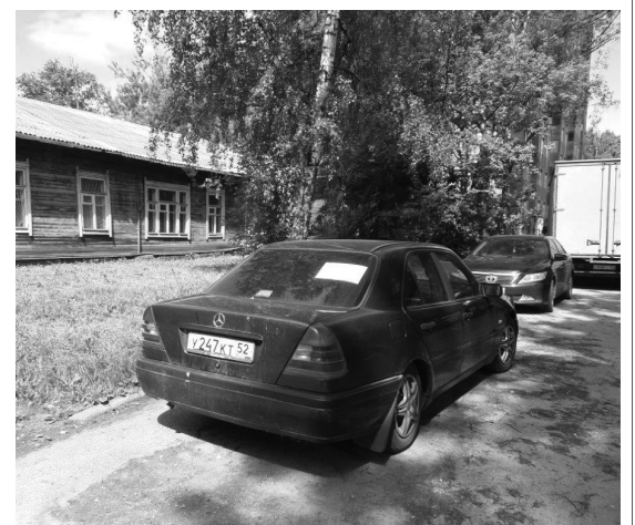
Транспортное средство расположено по адресу: г. Ярославль, ул. Ползунова напротив д. 6

Извещение о демонтаже и (или) перемещении самовольно размещенного объекта, не являющегося объектом капитального строительства, и освобождении земельного участка « 28 » мая 2021 года г. Ярославль Выдано: владелец не установлен (данные лица, самовольно разместившего объект: Ф.И.О. - для гражданина; наименование, адрес – для юридического лица) в отношении самовольно размещенного объекта ограждение (наименование незаконно размещенного объекта) расположенного по адресу: город Ярославль, ул.Базовая, вблизи здания д.3а В соответствии с приказом председателя комитета по управлению муниципальным имуществом мэрии города Ярославля от 20.04.2021 года № 1500 предлагаем в срок до «15» июня 2021 года Вашими силами и средствами демонтировать самовольно размещенный Вами объект и освободить земельный участок.