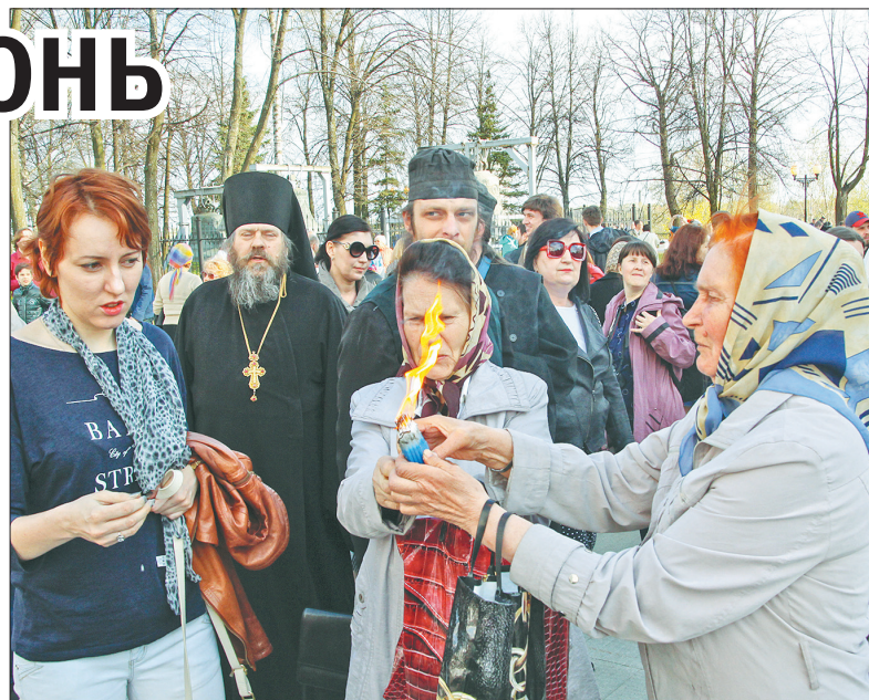
Люди делились друг с другом благодатным огнем.

падки, делились с другими верующими. Кто-то – сначала робко, а потом все смелее – проводил по пламени рукой.