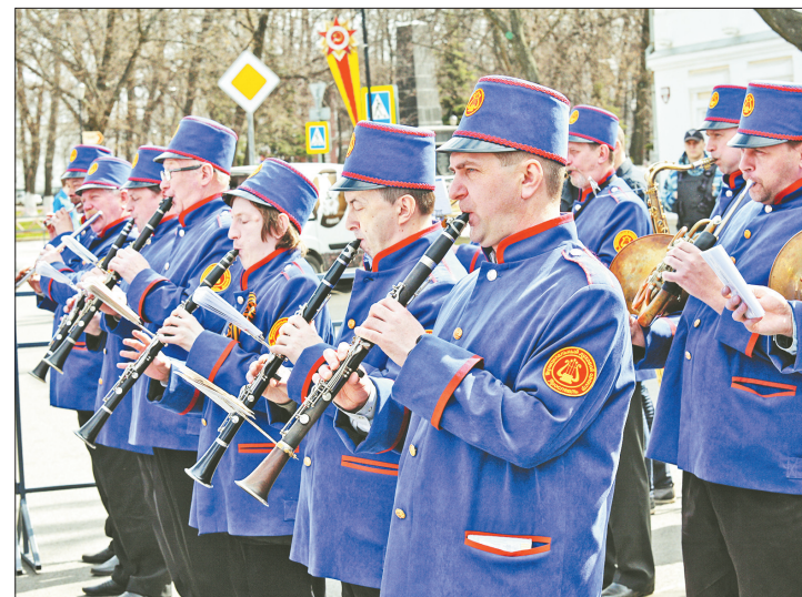
Для ярославцев Первомай по-прежнему радостный праздник. А в этом году и с погодой повезло.