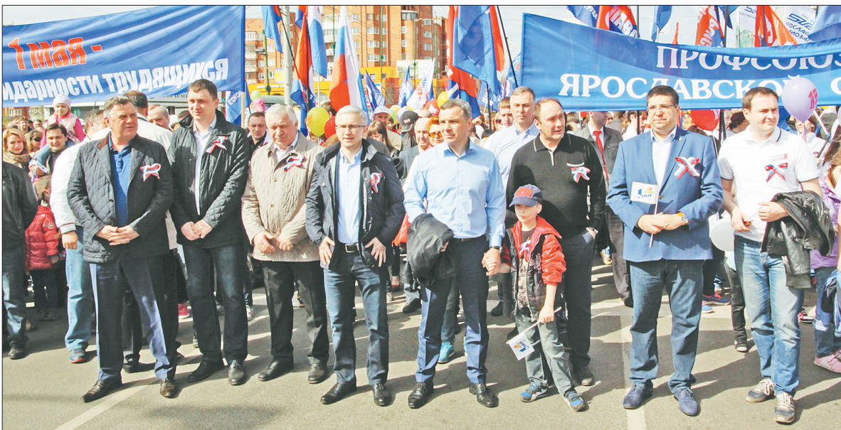
Руководители области и города на демонстрации.