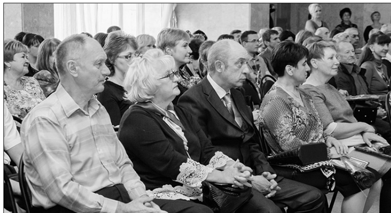
На чествовании победителей районного конкурса.