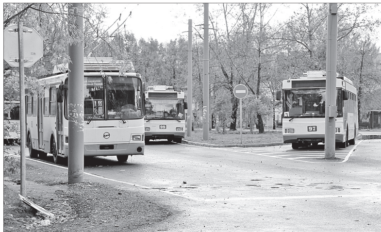
Улица Б. Норская отремонтирована по проекту БКД.